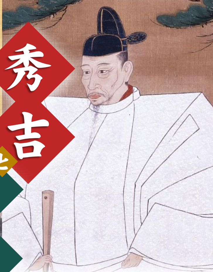
豊臣秀吉像 南化玄興賛 高台寺蔵