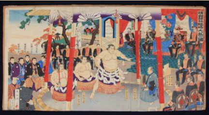
靖国神社遊就館蔵「靖国神社臨時大祭之図 大相撲土俵入」明治28年11月東洲勝月作・長谷川常次郎発行

神田には江戸から続く多くの商家があることをご存知ですか？ 講座では、伝統を担う方々に歴史と経営の極意、地域との繋がりについてお話をいただきます。