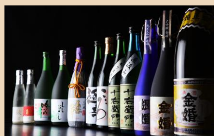
株式会社 豊島屋本店 提供