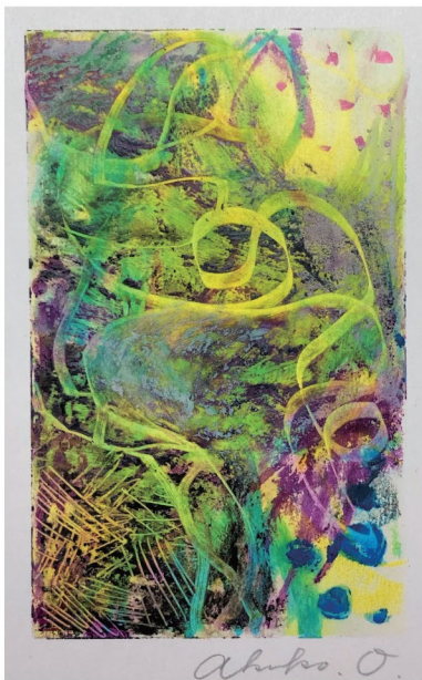
第1回 10/23 色面とマチエール