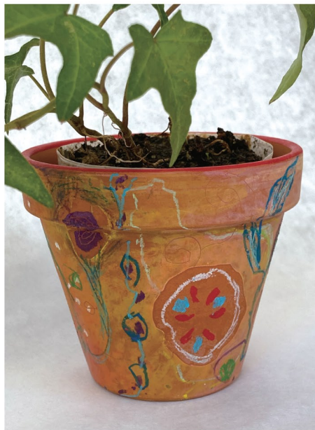
第2回 10/30 植木鉢に描く地中のアナログ画