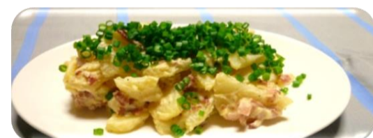
たまごとブロッコリーのパスタサラダ & カリカリベーコンのポテトサラダ