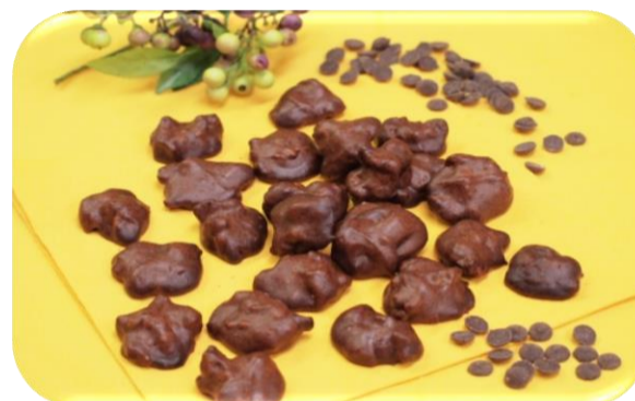
くるみのショコラクッキー

『米粉100%で作るふわふわレシピ』の プログラムはどなたでも参加可能です。 詳細は予約・受講方法をご確認ください！