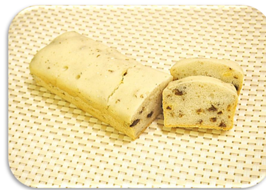
ソフトレーズンパン

『米粉100%で作るふわふわレシピ』のプログラムはどなたでも参加可能です。詳細は予約・受講方法をご確認ください！