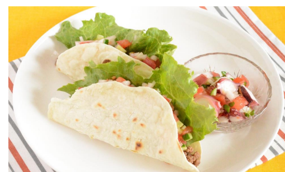
初夏のピリ辛メキシコごはん

『季節の彩りワンプレートごはん』のプログラムはどなたでも参加可能です。詳細は予約・受講方法をご確認ください！